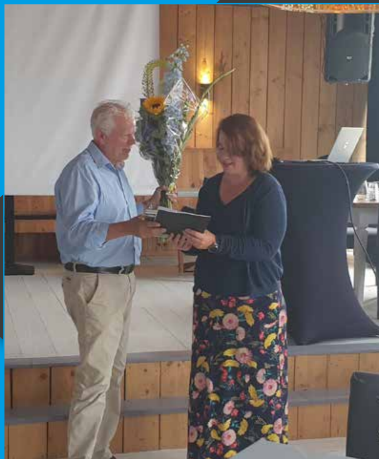
Overhandiging van het 1e exemplaar "evaluatie van het Ondernemersfonds"